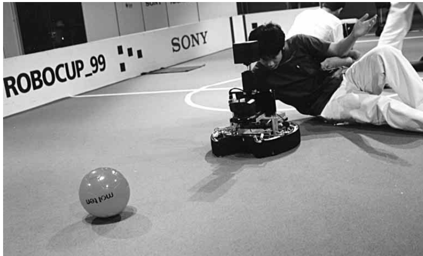
Mika Taanila: RoboCup99

ilmeistä asiaa, että Taanilan työ pohjautuu paljolti olemassa oleville kuville ja äänille, arkistomateriaalille. Jos leikkaisimme yhteen kaikki hänen teoksiaan varten kuvatut otokset, emme ehkä saisi aikaan kovinkaan pitkää filmiä.