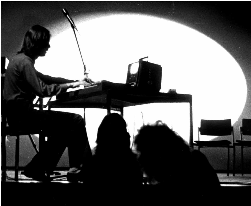
Mika Taanila: Tulevaisuus ei ole entisensä