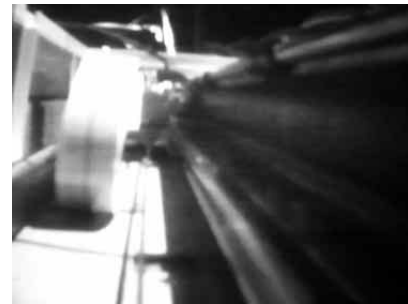
Mika Taanila: Optinen ääni